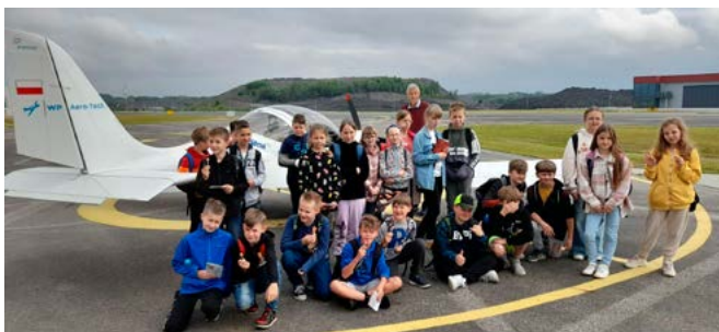
Uczniowie na płycie kaniowskiego lotniska