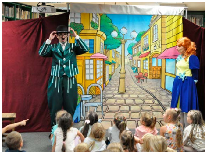
Scena z wesołego przedstawienia