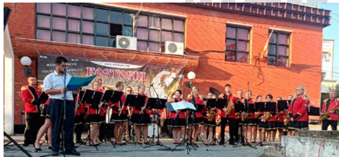
Występ festiwalowy w Ochrydzie

Pobyt w Macedonii Północnej (obecna oficjalna nazwa Macedonii po zmianie z 2019 r.) został urozmaicony licznymi atrakcjami i wycieczkami, między innymi zwiedziliśmy starożytną część miasta Ochryda oraz Muzeum Perel, z których słynie Jezioro Ochrydzkie. Mieliśmy okazję popłynąć rejssem po Jeziorze Ochrydzkim do miejscowości St. Naum, gdzie znajduje się grób Św. Nauma, który był uczniem Świętych Cyryla i Metodego oraz zażywać kąpiele w niezwykle czystych i ciepłych wodach Jeziora Ochrydzkiego. Warto dodać, że odpowiednio w 1979 i 1980 roku Ochryda i Jezioro Ochrydzkie zostały wpisane na Listę Światowego Dziedzictwa Kulturowego i Przyrodniczego UNESCO.