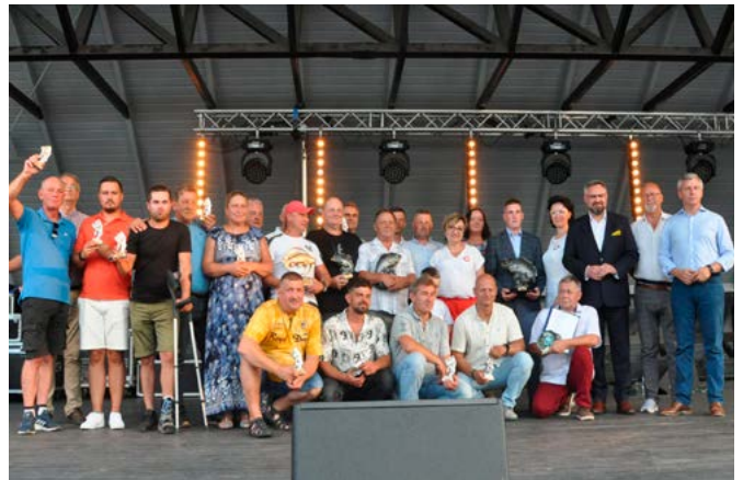
Goście imprezy oraz nagrodzeni wędkarze