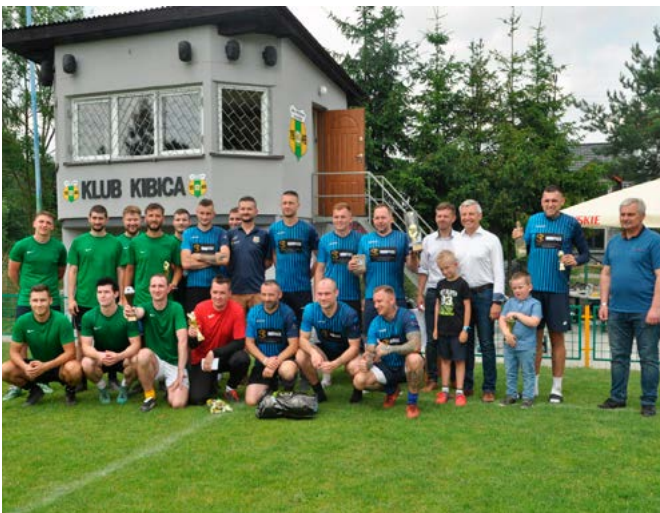
Piłkarze i działacze z pośłem Przemysławem Drabkiem