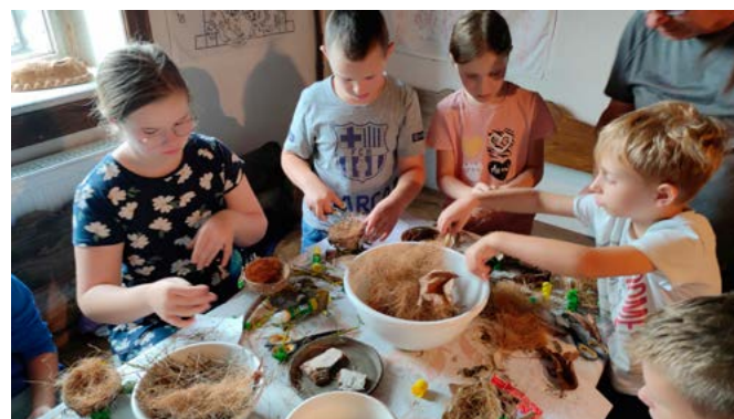
Warsztaty w Muzeum - wykonywanie ptasich gniazdek

Zajęcia w Muzeum Regionalnym w Bestwinie ukazały, że ptaki odgrywają ważną rolę w naszym życiu. Muzeum Regionalne udowodniło, że edukacja może być fascynująca i dostosowana do wieku uczest-