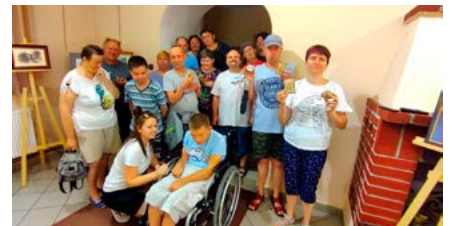
Wizyta w muzeum to szansa na integrację

Muzeum Regionalne w Bestwinie to miejsce, gdzie kultura i sztuka przenikają się z aktywno-