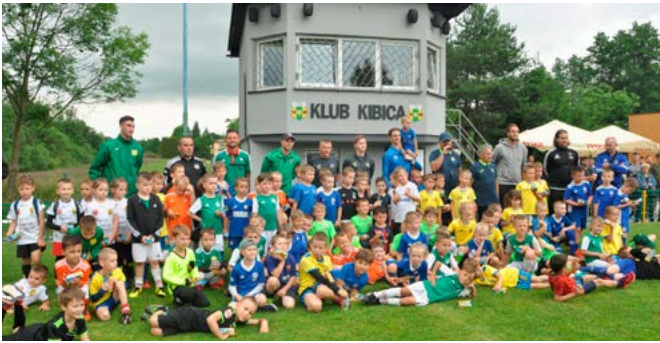
Zakończenie i podsumowanie turnieju