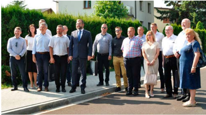
Goście obecni w dniu otwarcia

sowanie w ramach Rządowego Funduszu Rozwoju Dróg w kwocie 2 779 413 zł, 1 200 000 zł z „Polskiego Ładu”, a jego całkowita wartość zamknęła się w kwocie 6 800 000,00 zł.