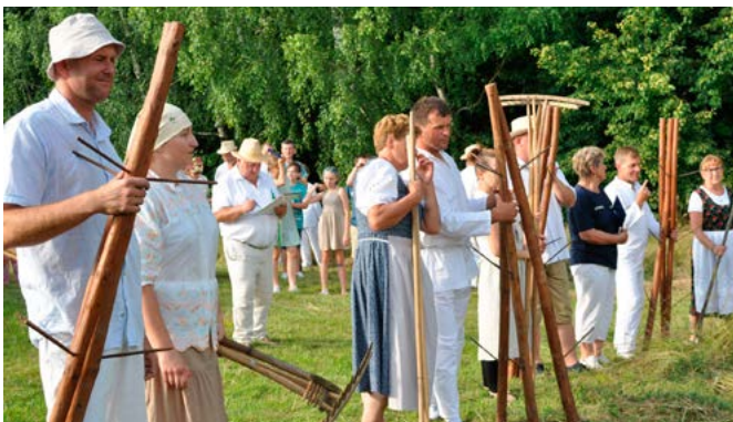
Zawodnicy już na starcie...