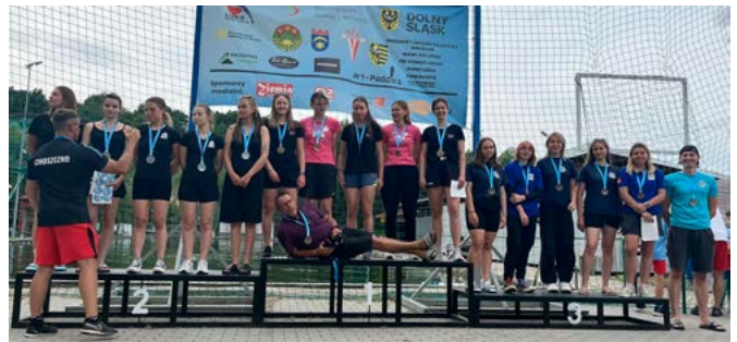
Juniorki UKS „Set” na podium w Leśnej