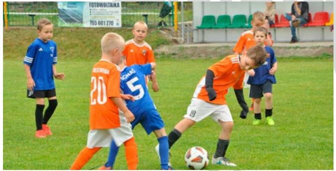
Jeden z rozegranych meczów

znajomi i mieszkańcy gminy Bestwina. Rodzice przygotowali zaplecze gastronomiczne; można było zakupić ciasta na wynos.