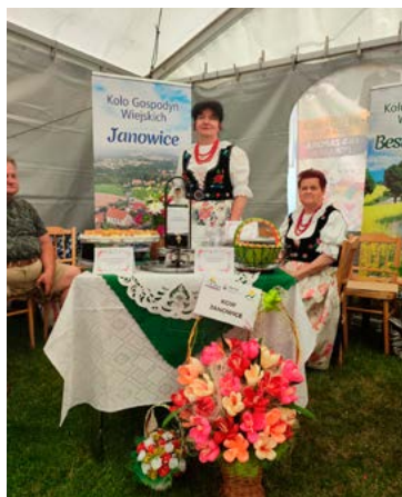
KGW Janowice zdobyło nagrodę za nalewkę

Koła Gospodyń Wiejskich z Bestwiny, Bestwinki, Janowic i Kaniowa wzięły udział w przeglądzie potraw regionalnych „Kulinarne Dziedzictwo”. Impreza odbywała się w ramach Święta Powiatu Bielskiego i gminy Porąbka (24-25 czerwca) na boisku sportowym LKS Zapora Porąbka. Wszystkie panie przygotowały oryginalne przysmaki: zupy, dania główne, desery, nalewki, ciasta i napoje. Komisja konkursowa miała więc niełatwy wybór. Wśród nagrodzonych znalazło się Koło Gospodyń Wiejskich w Janowicach – zdobyło I miejsce