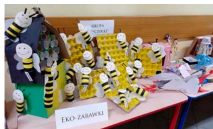
Wystawa prac uczniów

a także budowały budki dla owadów, jeży i wiewiórek. Wspólnie z nauczycielkami i rodzicami tworzyły karmniki, instrumenty i zabawki z materiałów z recyklingu, których wystawa miała miejsce na Pikniku Rodzinnym wieńczącym naszą innowację. Kończąc rok szkolny staliśmy się „bogatsi” o 202 małych ekologów dbających o środowisko naturalne, ciekawych dalszego poznawania świata przyrody i odpowiedzialnych za otaczający nas świat.