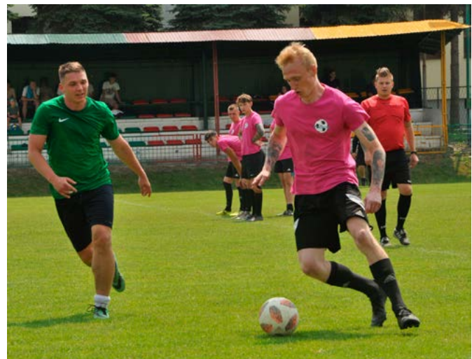
Rozgrywki toczyły się na boisku LKS „Przełom” Kaniów

Myśląc „dzikie drużyny” mamy często na myśli składy konstruowane ad hoc , grające raczej futbol na poziomie podwórkowym. Tymczasem ekipy biorące udział w wakacyjnych turniejach na boisku LKS Przełom Kaniów to bardzo często zespoły już ograne; wielu piłkarzy na co dzień występuje w prawdziwych ligach na różnym szczeblu rozgrywek. Dziesiąta edycja imprezy dowodzi, że ta forma uprawiania piłki nożnej ma sens i przy okazji stanowi szansę na spotkanie towarzyskie. 1 lipca 15 drużyn stawiło się w Kaniowie, by spróbować sięgnąć po puchar ufundowany przez pośła na Sejm RP Przemysława Drabka i inne cenne trofea.