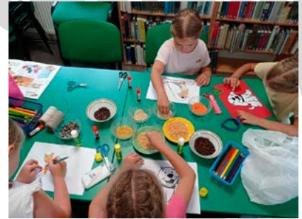
Zajęcia plastyczne w bibliotece

Akademii Pana Kleksa. Od teraz potrafią zapisać swoje imię przy pomocy włóczki („przedzenie liter”), czy odgadywać znaczenie najrozmaitszych przedmiotów z „rupieciarni”. Zwiedzając ciekawe miasta, niejednego zaskoczą wiedzą geograficzną, gdyż zabytki i interesujące miasta nie mają już dla nich tajemnic. Najmłodsze dzieci bawiły się na cotygodniowych przedstawieniach teatralnych przygotowanych w Gminnej Bibliotece Publicznej w Bestwinie. Wakacyjna inicjatywa bibliotek spotkała się z aprobatą dzieci i ich rodziców, frekwencja przeszła najśmielsze oczekiwania.