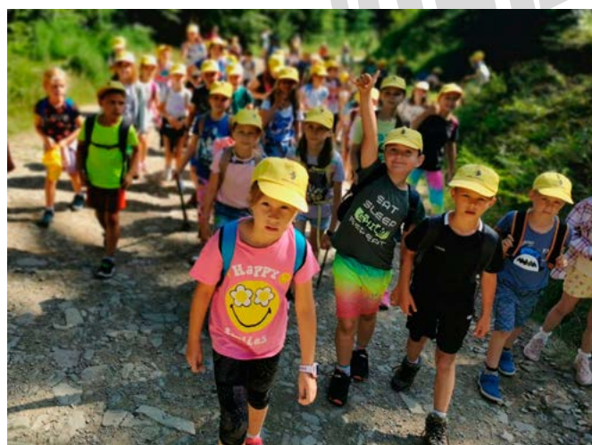
Na górskim szlaku

Opiekunowie tak podsumowują zakończone półkolonie: Podjęte działania profilaktyczno-wychowawcze, miały na celu dbanie o prawidłowy i wszechstronny rozwój dzieci poprzez wyko-