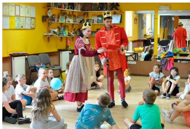
Spotkanie z królem i królową

Drugiego dnia uczestnicy przygotowali naturalne kosmetyki inspirowane opisywanym w legendach ptasim mleczkiem. Dzieci miały