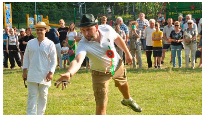
Rzut podkową do celu