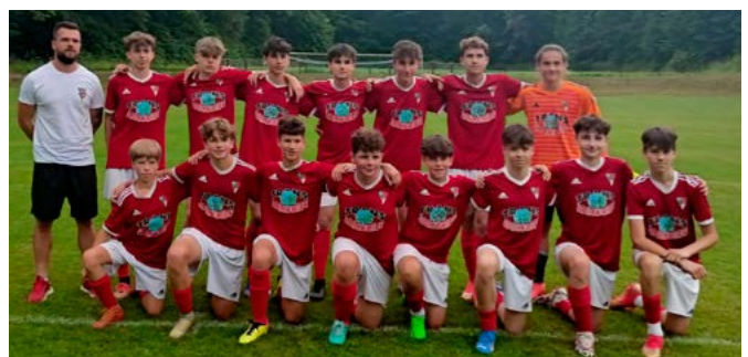
Młodzi piłkarze LKS Bestwina

Starsi kibice z pewnością pamiętają nadawany w telewizji program Piłkarska kadra czeka , popularyzujący piłkę nożną i zachęcający do uprawiania tego sportu. Pod takim też szyldem Zrzeszenie Ludowe Zespoły Sportowe organizuje rozgrywki dla mężczyzn i kobiet w różnych kategoriach wiekowych. W wojewódzkich finałach turnieju Duża piłkarska kadra czeka zorganizowanym 21 czerwca w Puńcowie przez śląskie zrzeszenie LZS, reprezentacja trampkarzy LKS Bestwina zdobyła drugie miejsce , ustępując tylko LKS Orzeł Moszczenica. Gratulujemy!