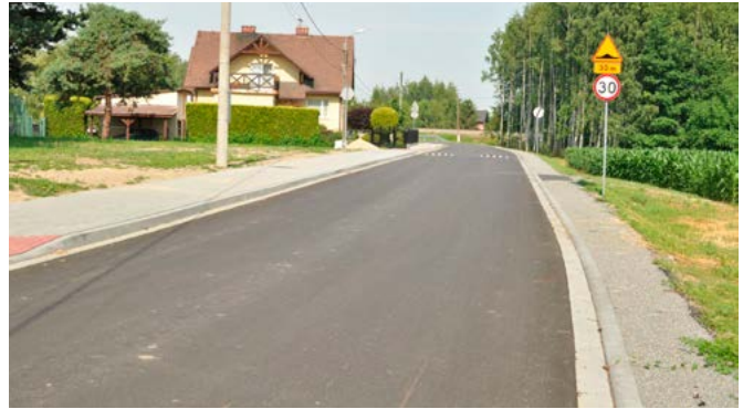
Ul. Sportowa - obok boiska KS Bestwinka