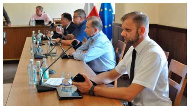
Dyskusja i podejmowanie uchwał