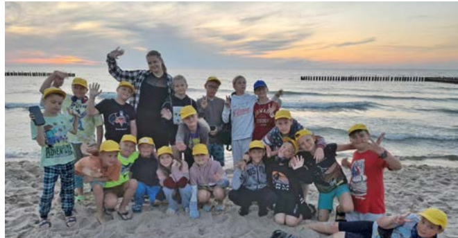
Pozdrowienia z nad Bałtyku!

Kolonia letnia do Jarosławca już za nami, brało w niej udział w lipcu ponad 60 uczniów szkół podstawowych z klas 3-8 z terenu gminy Bestwina. Każda z nich to doskonała okazja do poznania nowych miejscowości. Zwiedzanie tych miejsc oraz znajdujących się w nich atrakcji turystycznych może być fantastyczną przygodą i procentuje bogatym doświadczeniem w życiu najmłodszych kolonistów. Daje możliwość zdobycia kolejnych umiejętności, których wcześniej się nie posiadało. Dziecko postrzega swój wyjazd jako wielkie wydarzenie! Wypoczynek z rówieśnikami to świetny czas sprzyjający zdobywaniu nowych sprawności, a poznawanie atrakcyjnych miejsc turystycznych będzie wspomniane jeszcze długo... Dodatkowo kilkudniowa rozłąka z rodzicami jest doskonałą szansą do podejmowania samodzielnych decyzji i uczenia się odpowiedzialności.