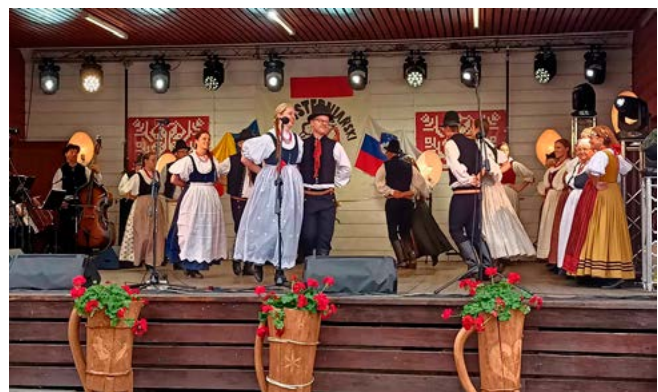
Występ w Istebnej

60. jubileuszowy Tydzień Kultury Beskidzkiej to największe w regionie i z pewnością najbardziej prestiżowe wydarzenie folklorystyczne, gromadzące zespoły z całego świata. W dniach 29 lipca-6 sierpnia, osiem miejscowości (Wisła, Szczyrk, Żywiec, Maków Podhalański, Oświęcim, Ujszoły, Jabłonków, Istebna) zaprosiło na występy kapel, grup śpiewaczych, solistów i innych formacji. Nie brakowało w tym gronie Regionalnego Zespołu Pieśni i Tańca Bestwina . Nasi reprezentanci wzięli w tym roku, w ramach TKB, udział w Festynie Istebniańskim (niedziela, 30 lipca), jak również w koncercie w amfiteatrze Pod Grojcem w Żywcu (czwartek 3 sierpnia). Zespół zaprezentował typowy dla ziemi bestwińskiej program pieśni i tańców lachowskich, unikalnych i chętnie podziwianych przez publiczność. Zachęcamy do obserwowania profilu społecznościowego RZPiT Bestwina.