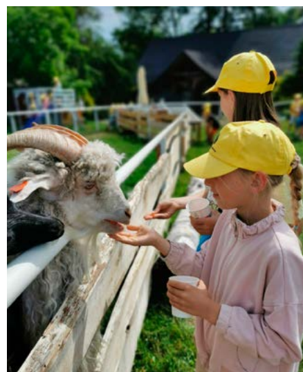
„AlpakCafe” w Starej Wsi

rzystywanie podczas zajęć elementów programów profilaktyki uniwersalnej, takiej jak „Przyjaciele Zippięgo”, „Apteczka Pierwszej Pomocy Emocjonalnej” oraz „Spójrz Inaczej”, które realizowane były przez wykwalifikowaną kadrę pedagogiczną. Celem nadrzędnym było rozwijanie podstawowych umiejętności społecznych i emocjonalnych oraz przygotowanie do radzenia sobie z trudnościami. Działania ukierunko-