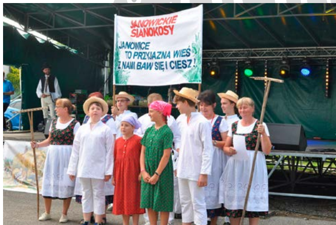
W turnieju sołectw zwyciężyła reprezentacja Janowic