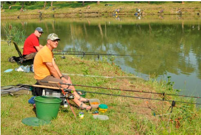
Zawody wędkarskie w Kaniowie